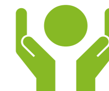
Pomoc dla Jemenu