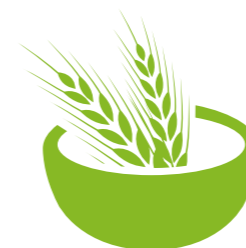
Pomoc dla Nigru